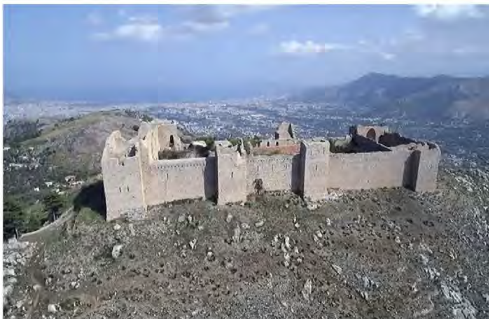
Castellaccio di Monreale

Gli incendi dei giorni scorsi che hanno colpito pesantemente il territorio di Monreale , non hanno danneggiato la struttura del Castellaccio , situato sul lato ovest di Monte Caputo. Colpita dalle fiamme è stata solo parte della vegetazione circostante il castello, e in modo molto lieve, qualche muro esterno alla struttura.