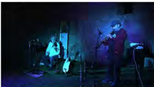
Il duo Rao Viola

«Castellaccio è stato assediato da sempre dagli incendi, questa volta il fuoco ha lambito la struttura, senza però danneggiarla. Anche perché la vecchia pineta circostante il castello era già stata completamente distrutta dagli incendi precedenti. In questo caso è tutto risultato nella norma, la corrente elettrica non è venuta a mancare e abbiamo intenzione comunque di proseguire la programmazione estiva anche per dare un segnale e dire che non sarà di certo un incendio a bloccare le attività di coloro che lavorano e vivono a Monte Caputo. C'è molta rabbia, perché è evidente che sono manifestazioni operate da parte di piromani. Ci auguriamo che si trovino al più presto i responsabili e che si faccia il possibile per contenere questo fenomeno in futuro. Una maniera per potere contenere incendi di questo tipo è la cura del sottobosco, quindi la pulizia. Noi nel nostro piccolo cerchiamo di farlo con i sentieri e stiamo investendo anche in questa direzione».